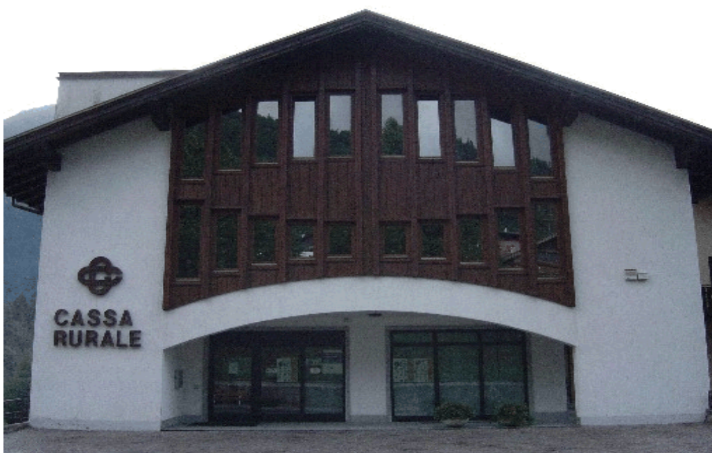
foto della Cassa Rurale Adamello- Brenta filiale di Breguzzo